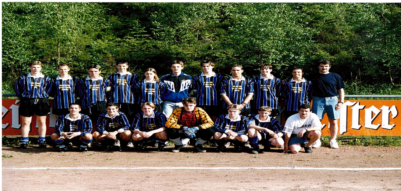
Bild: Die erfolgreiche A-Jugend des SV Farschweiler aus dem Jahr 1997 erreichte als Aufsteiger einen hervorragenden 5. Platz in der Verbandsliga (damals 2. höchste Spielklasse Deutschlands!), gewann den Landratspokal und die Kreishallenmeisterschaft und drang durch ein 3:0 gegen Eintracht Trier bis ins Viertelfinale des Rheinlandpokals vor, in dem man erst im Elfmeterschießen scheiterte.

Der SV Farschweiler ist ein kleiner, aber traditionsreicher Verein und hat in seiner Geschichte schon einige Höhen und Tiefen erlebt. Da waren die sportlich erfolgreichen Jahren Ende der 90er-Jahre, in denen wir im Seniorenbereich, aber auch im Jugendbereich auf überregionaler Bühne Erfolge feiern durften.