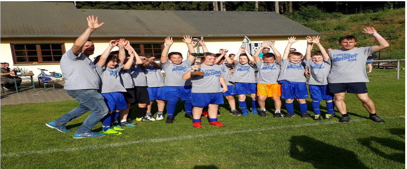
Bild: Unser damalige E-Jugend bejubelt ihre Staffelseisterschaft 2019