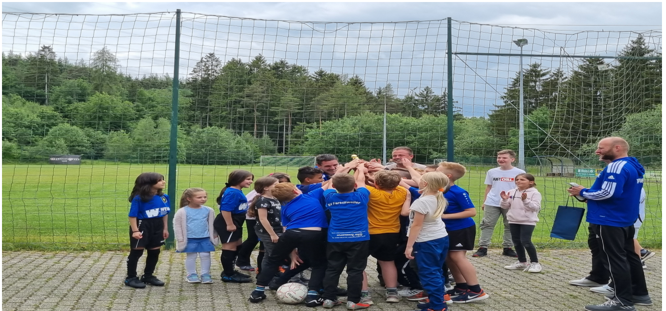
Bild: Auch 2023 wird unsere eigene E-Jugend Staffelseister

Aber auch im Seniorenbereich konnten wir junge Spieler aus Farschweiler wieder für den Verein gewinnen, so dass wir mittlerweile eine der jüngsten Mannschaften in der Kreisliga C stellen. Auch sportlich ging es dabei in den letzten Jahren bergauf. So spielen wir nach vielen Jahren Abstiegskampf aktuell wieder um den Aufstieg in die Kreisliga B.